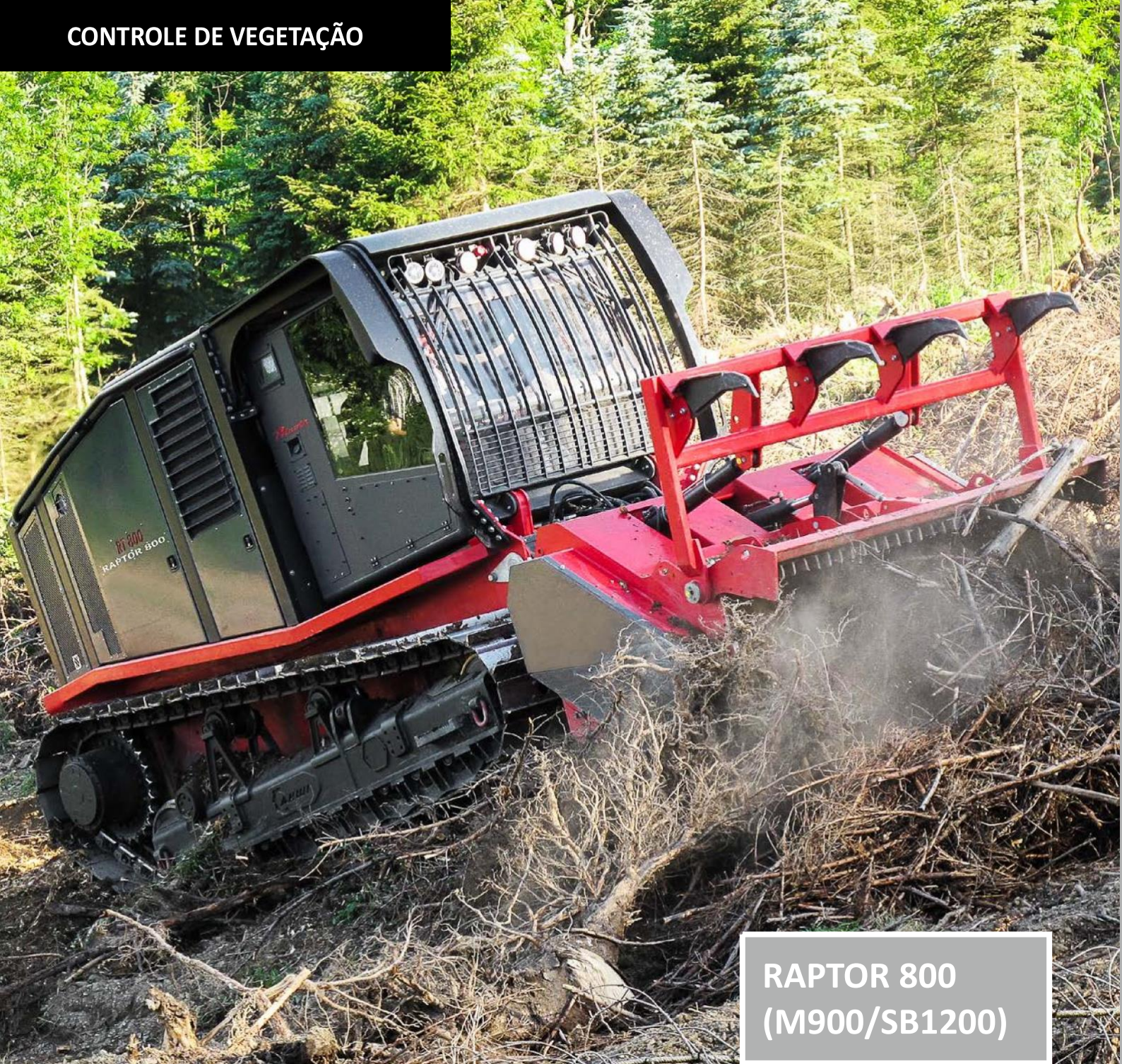
RAPTOR 800 (M900/SB1200)